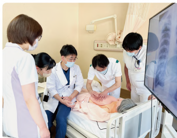
(フィジカルアセスメント 実習)