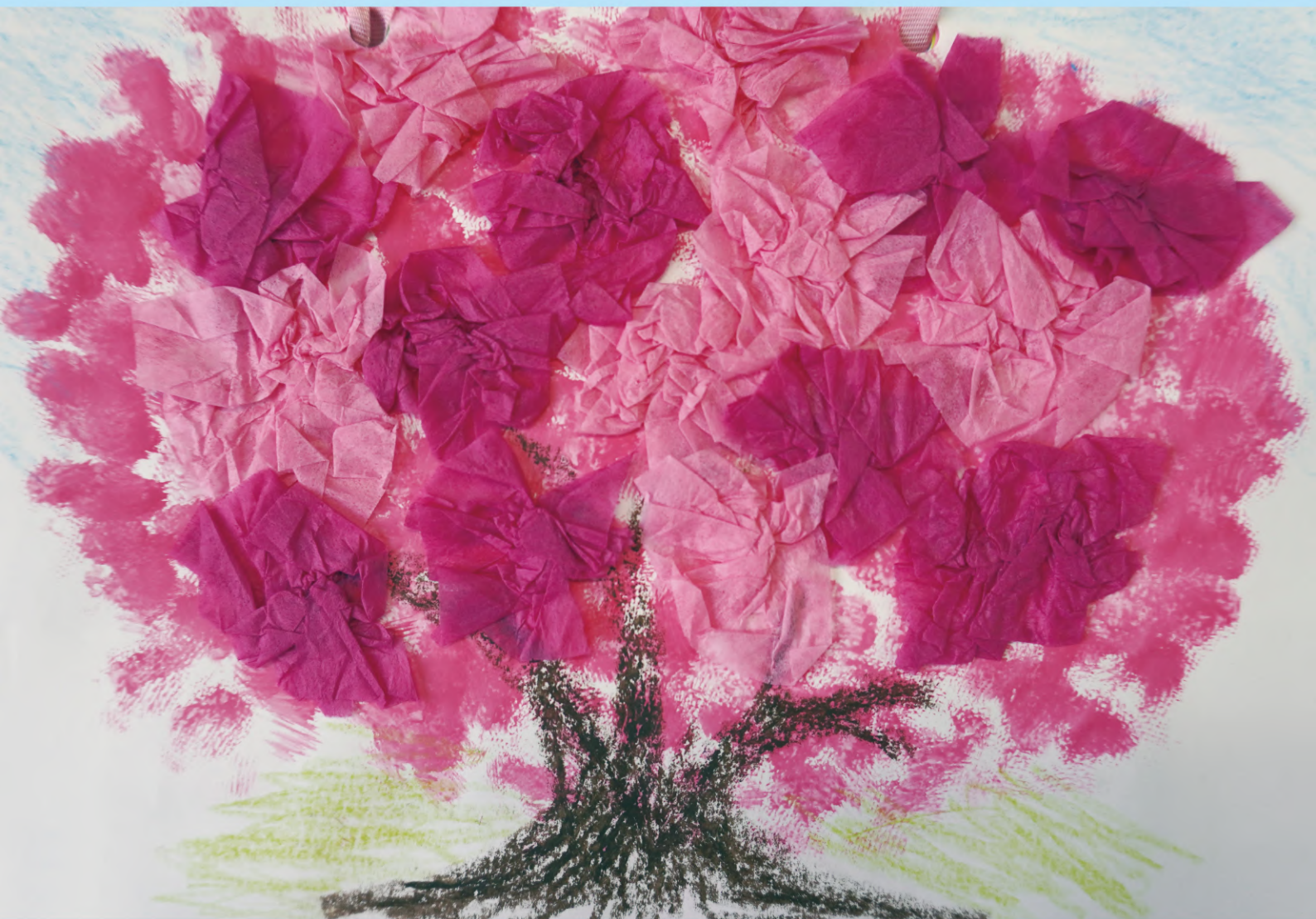
作品名：桜 作者：舟橋正江 様