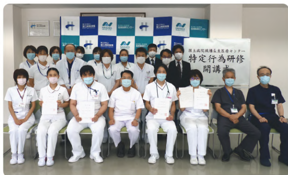
(特定行為研修開講式)